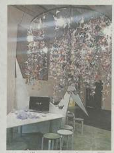
ベルギー・ルーバンの原爆企画展では、折り鶴の形をした机で鶴が折れるようになっている=11月