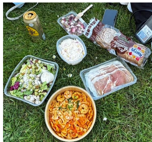
公園でピクニックも