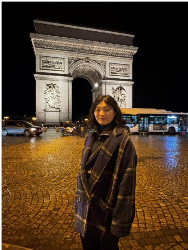
凱旋門前でパシャリ