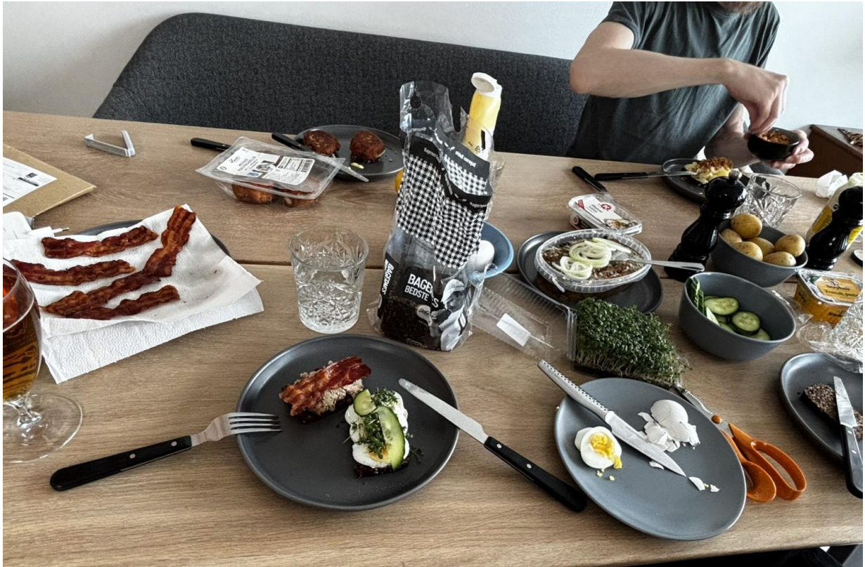
友人がオープンサンドを作ってくれました！激ハマリ