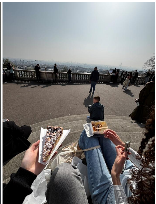
モンマルトルでお昼ご飯を食べたときの1枚