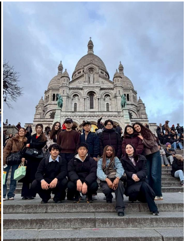
現地学生とプロジェクトで来た日本人学生の観光案内をしました。通訳を初めて経験！