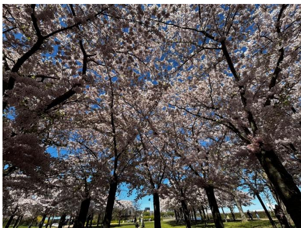
ヨーロッパでもたくさん桜を見れました